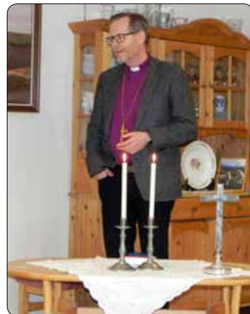
Vik fengsel fekk også besøk