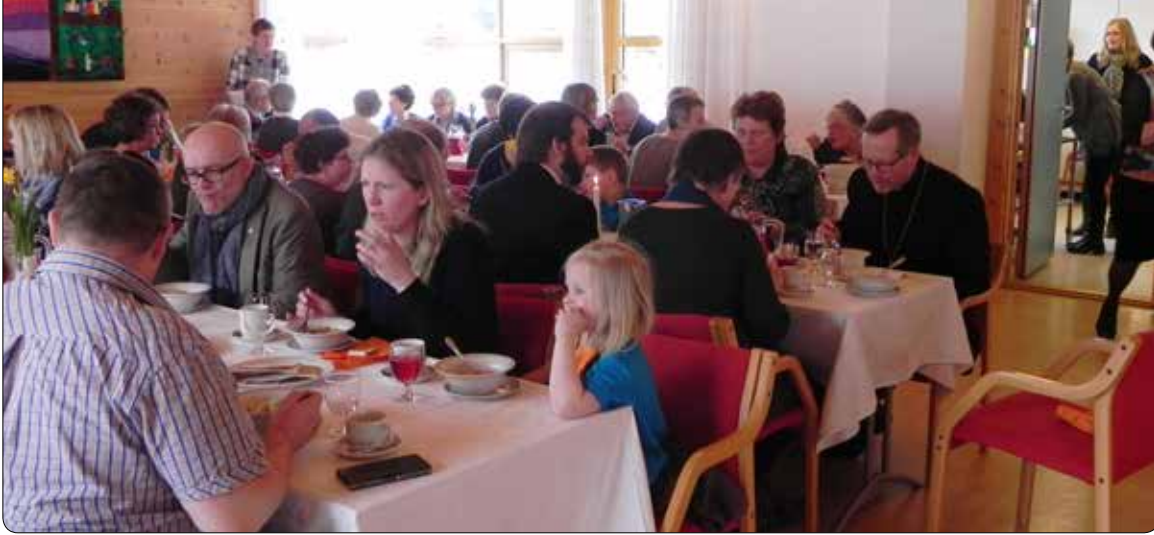
På kyrkjelunsjen vart det servert suppe og marsipankake & kaffi.