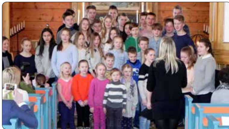
Familie- og skulegudsteneste i Feios: